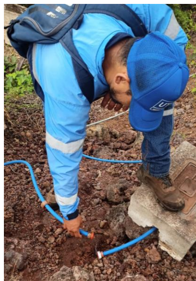
Rehabilitación y mejoramiento del pozo profundo